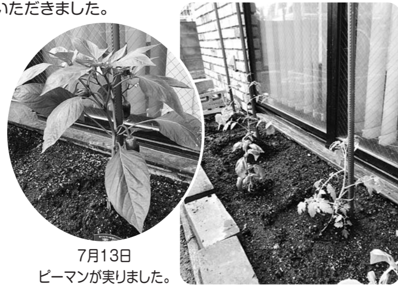
7月13日 ピーマンが実りました。

その一環として、家庭菜園をはじめました。利用者様にも、土の選別や入れ替え、苗植え等の作業を一緒に行っていただきました。