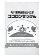
ココロン せっけん

②年間3,000円以上の「口座振替」の新規契約、 または3,000円以上増額をした方 ★ココロンせっけん、または長息生活をプレゼント (腹式呼吸・呼吸力等維持訓練用吹き戻し)