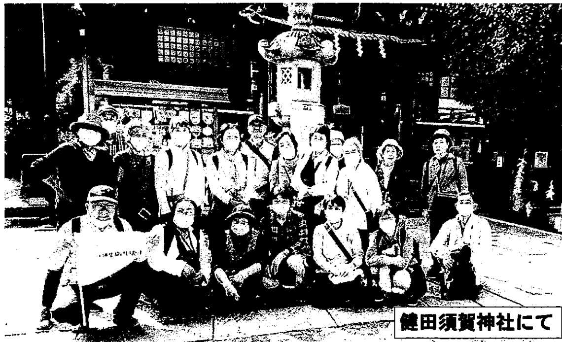
健田須賀神社にて

4月19日に結城市に行ってきました。春うららのウォーキングの最適な日でした。参加者は20名。古い城下町、結城紬で有名です。立派な寺社、結城城址公園等を回りました。結城駅前の観光物産センターでみやげを物色。