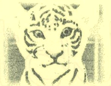
人気のホワイトタイガー